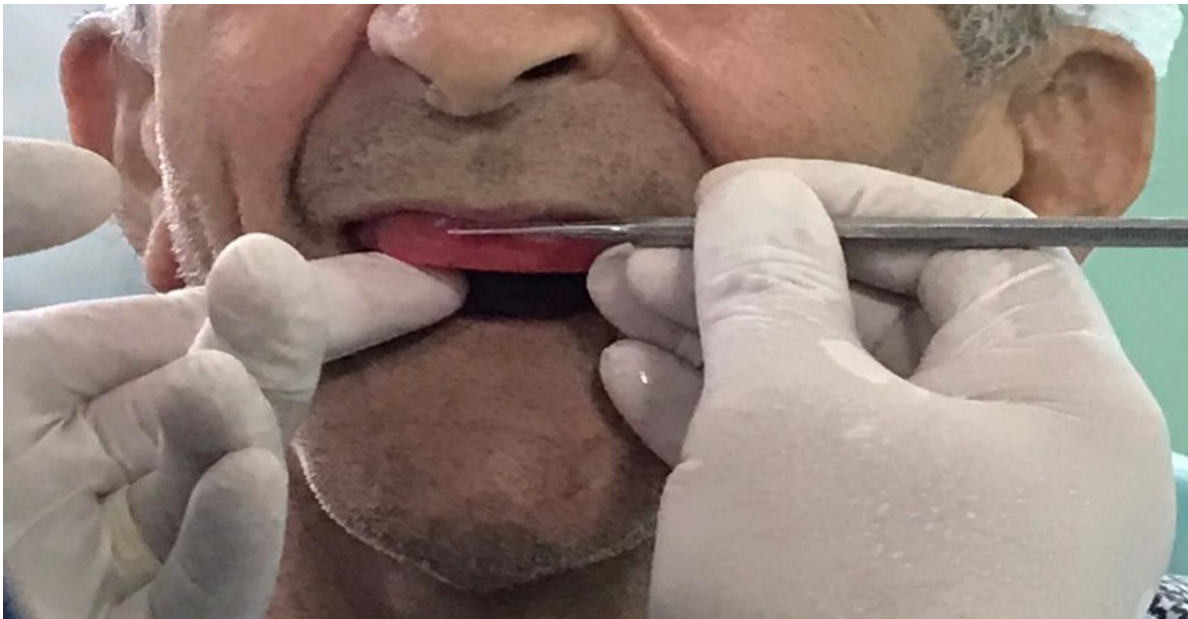
Figura 4 – Registro de referências da linha média e sorriso