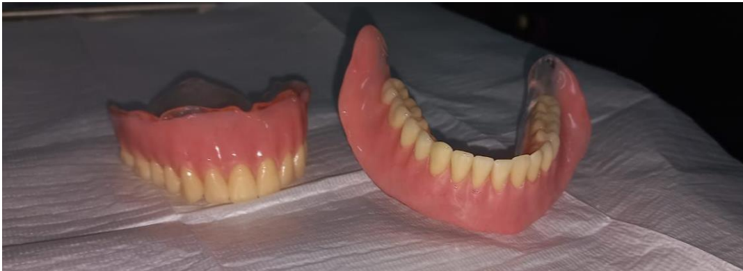
Figura 5 – Prótese removível superior e inferior finalizadas