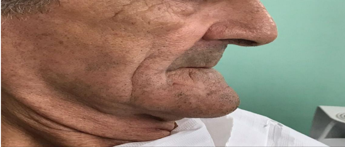
Figura 1- Perda do suporte labial superior e inferior e mento protuído