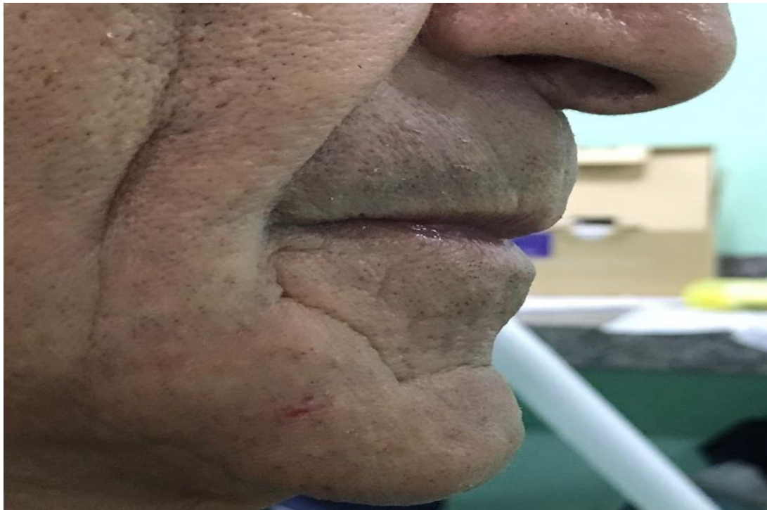
Figura 6 – Ganho de dimensão vertical da oclusão e ganho de suporte labial