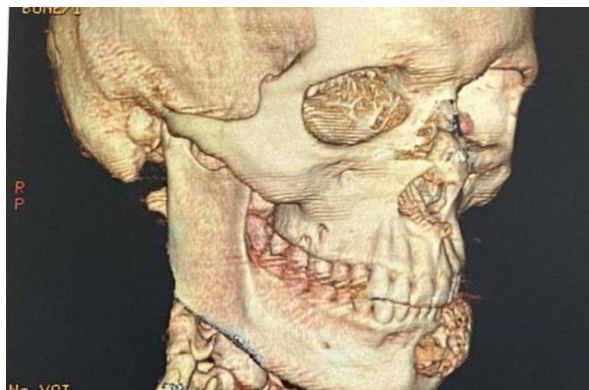
Figura 6: Vista lateral direita da TC.