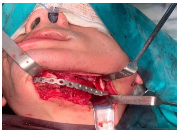
Figura 10: Ressecção total da lesão.

Após o resultado da biópsia, devido ao aspecto clínico da lesão, agressividade, reabsorções dentárias e ósseas, optou-se pela cirurgia de ressecção total da lesão, seguido de reconstrução com placa e parafuso de titânio, sistema 2.4 mm (Figuras 10, 11, e 12). Após um ano de remoção da lesão, observou-se uma neoformação óssea (Figuras 13 e 14).