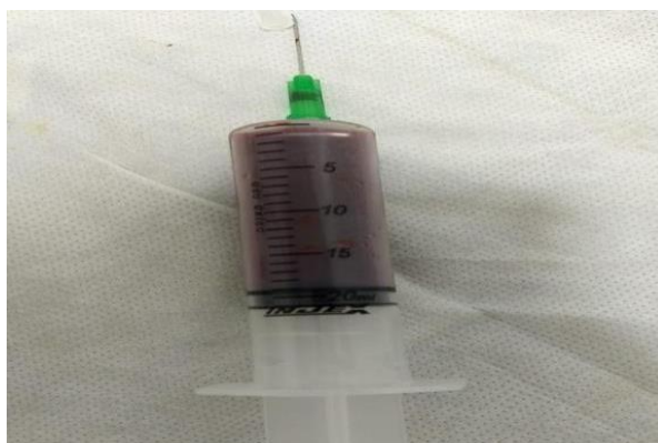
Figura 9: Punção aspirativa

Como conduta, realizou-se biópsia incisional de região de corpo mandibular esquerdo, obteve-se como diagnóstico de ameloblastoma multicístico.