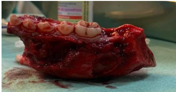
Figura 12: Ressecção total da lesão.