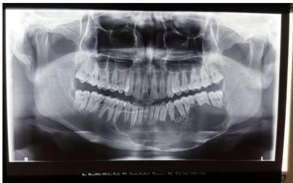
Figura 5: Exame radiográfico: lesão que se estendia da região de ângulo mandibular esquerda à região de corpo da mandíbula direita.

Realizou-se a tomografia computadorizada (TC) como exame complementar (Figuras 6, 7 e 8), que demonstrou uma lesão acometendo a região mandibular. Realizou-se punção aspirativa para descartar lesão vascular (Figura 9).