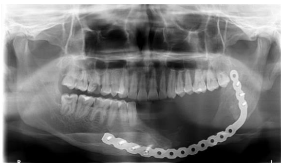
Figura 14: Exame radiográfico.

O paciente encontra-se em acompanhamento sem recidivas da lesão (Figuras 15 e 16).