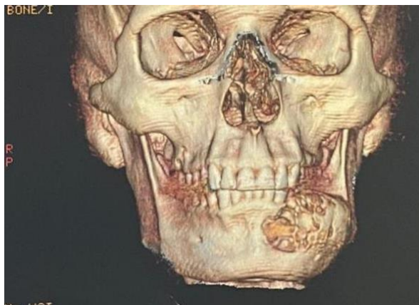
Figura 8: Vista frontal da TC.

Como conduta, realizou-se biópsia incisional de região de corpo mandibular esquerdo, obteve-se como diagnóstico de ameloblastoma multicístico.