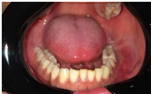
Figura 4: Vista intra-oral.