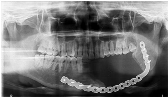
Figura 13: Exame radiográfico.