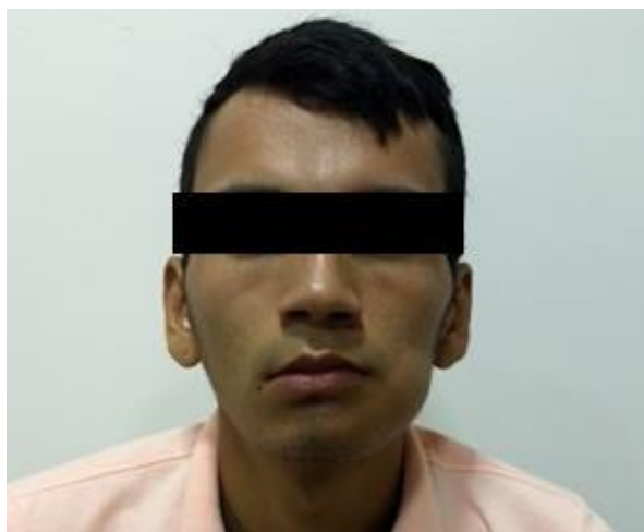
Figura 3: Vista frontal.